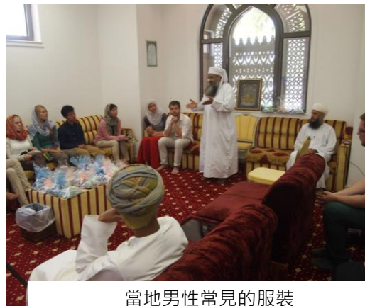
當地男性常見的服裝

再來則是齋戒月，齋戒月為伊斯蘭教中非常重要的一個節日，在為期大約三十天的時間內，所有信徒在這段時間的日出到日落，不只食物不能吃，連水也不能喝，甚至如果在其間說出食物的名稱都算是破