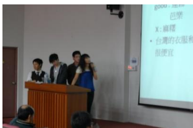
交換學生成果報告

交換以及一些訓練的時間大約會用到一年的時間，雖然整體來說事情不多，但是 散佈在一整年，至少對我來說，會覺得非常的煩躁，尤其是當你在忙的時候，室 友都在旁邊打電動，或是有很多事情都要花費許多時間才能確定，會有許多時間 你是在等待，不過，在經過所有的一切後，我可以保證你會覺得一切都是值得的。