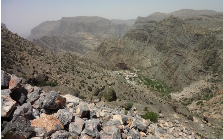
阿曼可以是一片亂石

阿曼蘇丹國 ( 阿拉伯語 : عُمان سلطنة , 英語 : Sultanate of Oman , 簡稱阿曼 , 中國古 代稱其為「祖法兒」 ) 是位於 西南亞洲 , 阿拉伯半島東南沿 海的一個國家 , 西北與阿拉伯