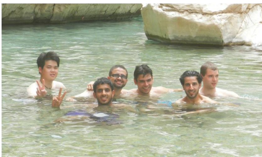
有不少時間會泡在水裡

從上述的情況可以得知，幾乎所有的行程都必須是當地學生幫你安排，所以接待學生相對之下扮演了極重要的角色，我交